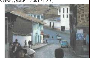
1984年秋 ペルー・クスコ 近景：【建物】〈匿名〉スペイン建築の伝統を残した家並み 【人物】〈活動〉日本人に似た容姿の人々の人影

①クスコの家並みの表情は静かに沈んでいた。なんという美しさ。インカ・インディオは蒙古系種族という。遠い昔、その種族は当時地続きのペーリング海峡を経て、南米大陸の果てのフェゴ島にまで到達したという。②衣服の伝統が違うが、日本人とよく似た容顔の人びとに出会う。③スペインの建物の伝統を強く残した家並みに、④この人影が重なると、親しさと哀しみが私のなかで激しく交錯した。