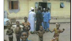
1974年秋 コートジボワール・アビジャン 近景：①【建物】〈匿名〉ペンキ塗りの民家 ②【人物】〈活動〉タムタムの音と踊る少女たち

アジャメの市場の裏で、①鮮やかな青や紫のペンキを使っているが、全体では沈んだ美しい調子をもった民家をつぎつぎとたどっていったら、②タムタムの音が聞えた。単調な音だが、現地のタムタムの発信場所を見つけた。通りの向こうの民家にタムタムを打つ一団が大勢の子供に取りまかれて入っていたのが見えた。私も急いでかけつけ、笑ってどうぞというポーズをとる通りがかりの男と一緒に小さな民家の中庭に入った。③タムタムに合わせて、ときどき飛びはねるようにして少女たちが輪になって踊っていた。終わったから先に通りに出て待ちかまえていた私のカメラに、それまで一緒になかにいた子供たち全部がうつっていた。