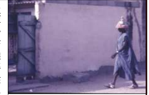
1974年秋 セネガル・ダカール 近景：①【街並み】〈近景〉現代都市空間 ②【人物】〈活動〉黒人男性の移動

①祭の外には現代都市が、正確に言えば現代フランス的な整った都市があった。ダカールの中心インデパンダンス広場の一角に建つアラバホテルの最上階の12階の私の家から見た光景が、私のブラック・アフリカ都市の〈横断〉の出発点であった。…真下のホテル前の黒っぽいアスファルトの広場を、②鮮やかな青の長い上衣をまとい、白いバンタロンをはいた黒人の男性の、平面図に近い小さな映像がゆくりと横切っていく。何でもない現代都市の空間がアフリカの空間に変質した。まだ10時前だが、外は暑そうだ。