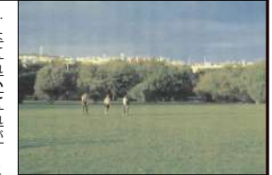
1972年秋 ポルトガル・リスボン 遠景：①【街並み】〈遠景〉夕陽に輝く住宅

数日後の夕方、私はリスボンのベレン地区にいた。… ①ふと向こうの樹の梢の形に沿うようにして真白な雲のような、しかし、もっと硬質なものが広がっているのに気づいた。遠い風景のようだ。突然、それが少し離れたリスボンの市内の丘陵の上を埋めている。私の真後から届いている夕陽を真正面を受けて真白に輝いている住宅の群れであることが理解されたとき、私の体のなかを表情しがたい激しい感情が一瞬貫いた。これが〈人の住む〉という光景なのだ。いつも綿延して考え続けている、人が住むということの原光景を私はそこに見た。