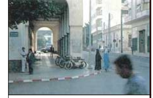
1972年秋 モロッコ・カサブランカ 近景：①【建物】〈匿名〉フランスの現代建築 ②【人物】〈活動〉民族衣装の女性たち

華やいた、浮き立つような興奮が、フェズからふたたび戻って、ゆっくりと歩きまわったカサブランカの大通りの上で、私をとらえた。①北アフリカ唯一の近代都市のこの大通りはフランス系の現代建築がゆったりと並んでいた。建築家である私にはそれはむしろ日常的な風景であったはずだ。だが、私は明確な理由も見当たらないままに気持が高ぶってきた。②黒いベールで顔を覆った民族衣装の女性たちに出会う。フランス系ヨーロッパとアラブ系アフリカは溶け合わずに、それぞれが明確な輪郭をもったまま、しかも分解できない空間と時間が絞られていた。