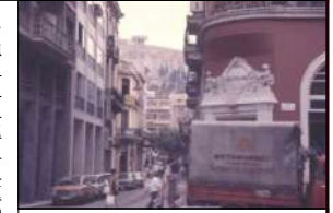
1973年夏 ギリシャ・アテネ 近景：①【建物】〈匿名〉フランスの現代建築 ②【建物】〈匿名〉アクロポリスと神殿 ③【インフラ】〈道〉道の形状 ④【人物】〈活動〉女性たち、少女少女

通りをアクロポリス寄りに選べば、つぎの十字路の左手、①二、三階建ての商店の街なみが挟んだ通りの正面には②北寄りのエレクテオンの背面であるうか、神殿が岩壁の上に現れる。③古い街プラカはアクロポリスの北側直下に広がっているから、プラカのなかのアクロポリス沿いの狭い道は北斜面の地形の等高線を示すように通っていた。④太陽はもう真西に来て通りの隅々まで照らしていた。白あるいは薄黄の民家の壁が輝いて続いていた。⑤道と直交する細い路路の上には荒々しい岩肌があった。⑥女性たちがおしゃべりをしていた背後にも、写真をとって送ることを約束した四人の中学生らしい少女少女のすぐ上にも、②アクロポリスと神殿があった。